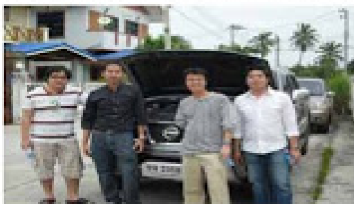
NAVARA 174HP 4x4 (ธุรกิจส่วนตัว)