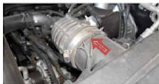
จุดใส่สายไฟ 3 เส้นในท่อไอศึ่สำหรับทุกรุ่น