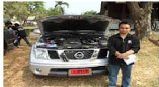
NAVARA 144HP CALIBRE (ตัวแฟนซ็ยเซ็ค)