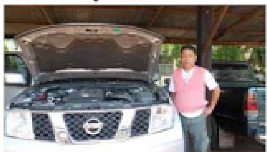
NAVARA CALIBRE ( กก. ศษค. 34)