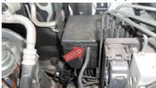
จุดเชื่อมระบบไฟผ่านกล่องฟิวส์