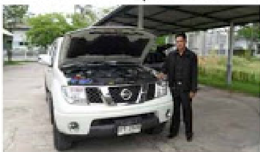
NAVARA CALIBRE 4D (พททช ส.22)