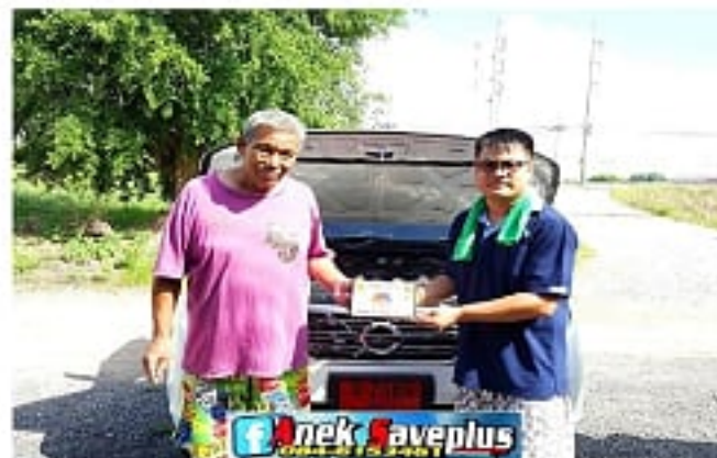
NP 300 ตอนเดียว