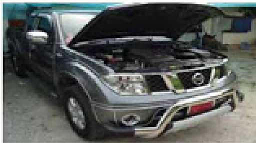
NAVARA 174HP 4x4 (รถทาดซอบเซฟไฟลด์ 3 ตัว)