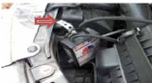
จุดติดตั้งรถสอง(SP1) NAVARA ทุกรุ่น