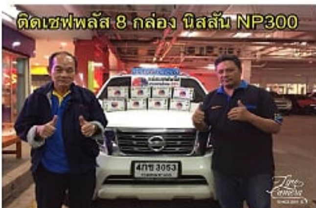
NP 300 ใส่ 8 กล่อง