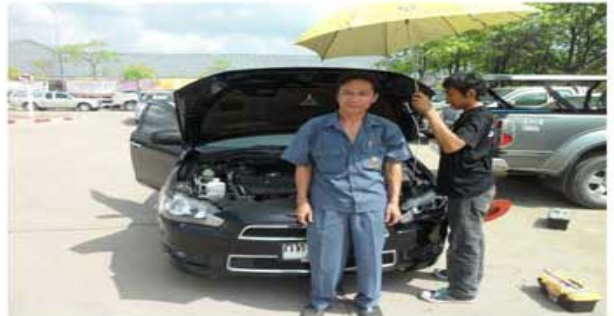
LANCER EX (พนักงาน กฟผ. แม่เมาะ)