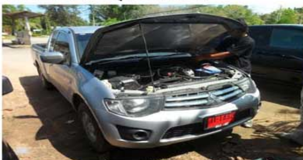
TRITON CNG (ค้าขาย)