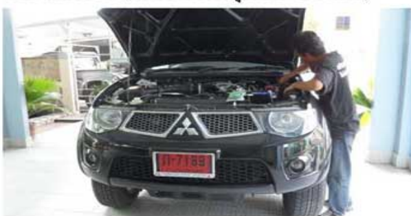
TRITON LPG (ธุรกิจส่วนตัว)