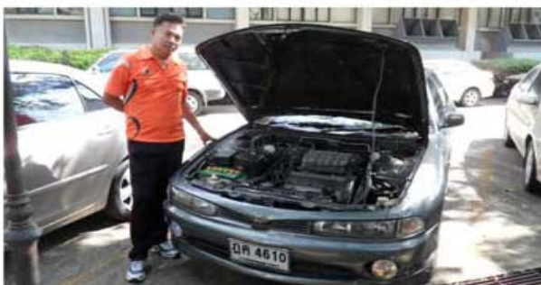
ULTIMA 2.0 (ทหารกรมยุทธโยธา ทบ.)