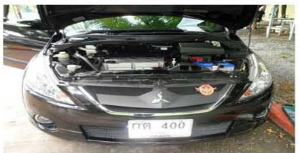
SPACEWAGON (ผู้กอง สปท. บก.ทท.)