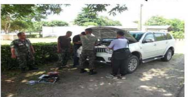
PAJERO V6 LPG (กรมทหารราบที่ 2 รบ.)