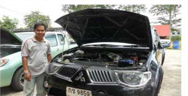
TRITON CNG (ทหารกรมทหารราบที่ 12)