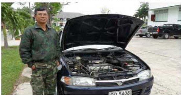
LANCER (ทหารกองพันทหารสื่อสารที่ 3)