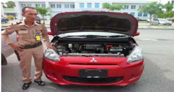
MIRAGE ป้ายแดง (ทหารทัพเรือภาค 2)