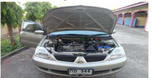
LANCER CNG(ทหารกองพันกระสุนที่ 24)