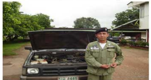
B 2500 ( ตชด. 125 ตาพระยา )