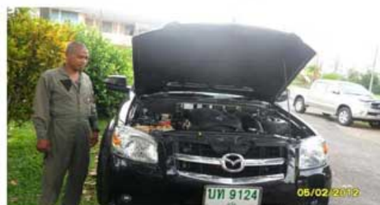
BT-50 (ทหารกองพันทหารราบที่15พัน4 ตรีง)