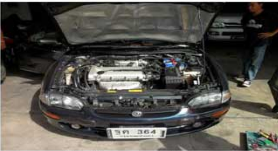
LANTIS (หัวหน้าแผนกขนส่งทหาร)