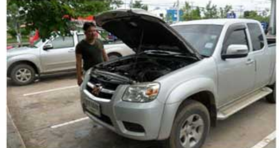
BT-50 (ทหารกองกำลังบูรพา สระแก้ว)