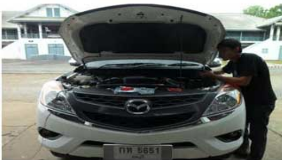
BT-50 PRO (กองพันป้องกันฐานบิน ศบบ.)