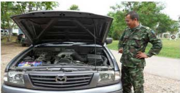
FIGHTER 2500 (ทหารกองทัพบกที่ 2)