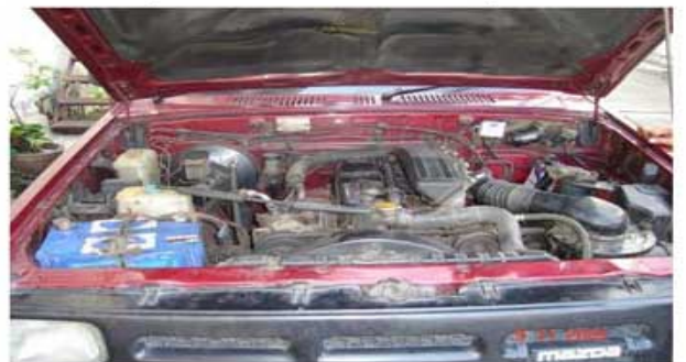
B 2500cc. (ร้านค้าวัสดุก่อสร้างศรีราชา) 9