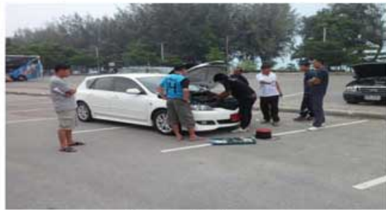
MAZDA 3 (พนักงานบริษัทเอกชน)