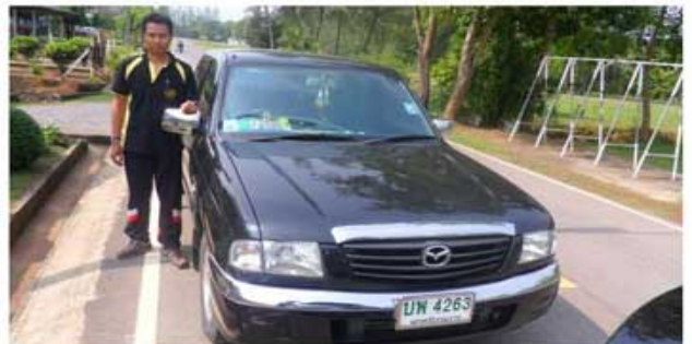
FIGHTER 2500 (ทหาร ป.พัน 15 ทุ่งสง)