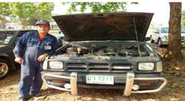
B 2500 ( ทหารกองโยธาธิการกองบิน 1)