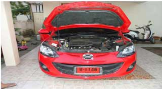
MAZDA 2 (หัวหน้าพนักงานอมตะนคร)