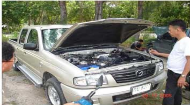
FIGHTER 4ประตู (ตำรวจ สภ.ต.แสนสุข)