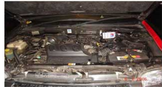
TRIBUTE 3.0(เจ้าของธุรกิจส่วนตัว)