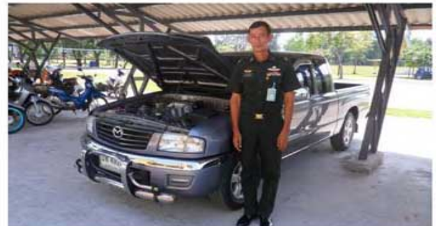
FIGHTER 2500 (ทหารกองพันทหารช่างที่5)