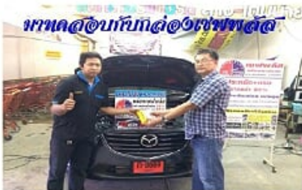
CX - 5