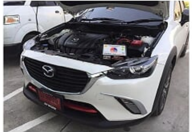
CX - 3