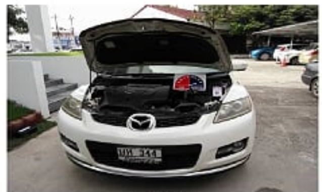
CX - 7