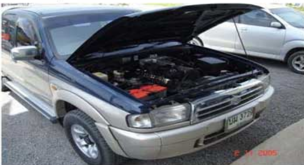
MAZDA 2900cc. (เจ้าของธุรกิจรถทัวร์)