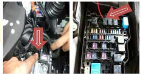
MAZDA 626 / LANTIS