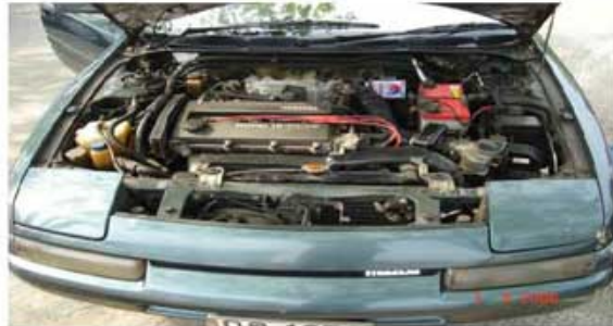
ASTINA (พนักงานสโมสรราชพฤกษ์)