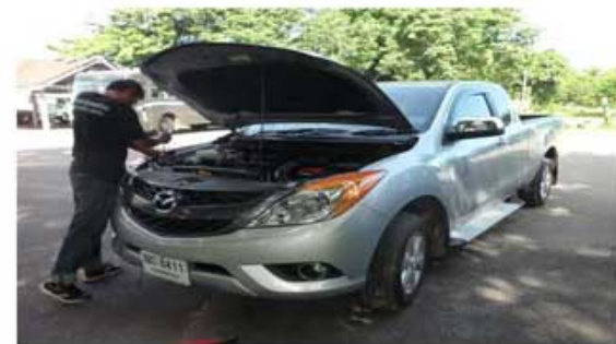
BT-50 PRO (ทหารช่าง ช.พัน 2 รอ.)