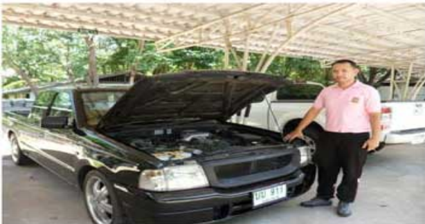
FIGHTER 2500(ทหารกรมทหารราบที่6 อุบลฯ)