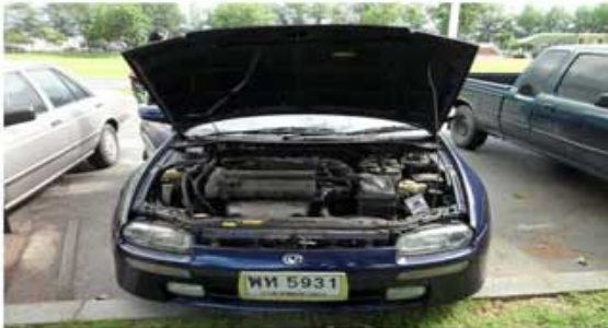
MAZDA 626 (ทหารกรมการทหารช่าง)