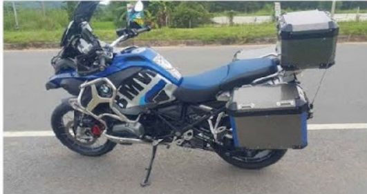
BMW R 1200 GSA /LC